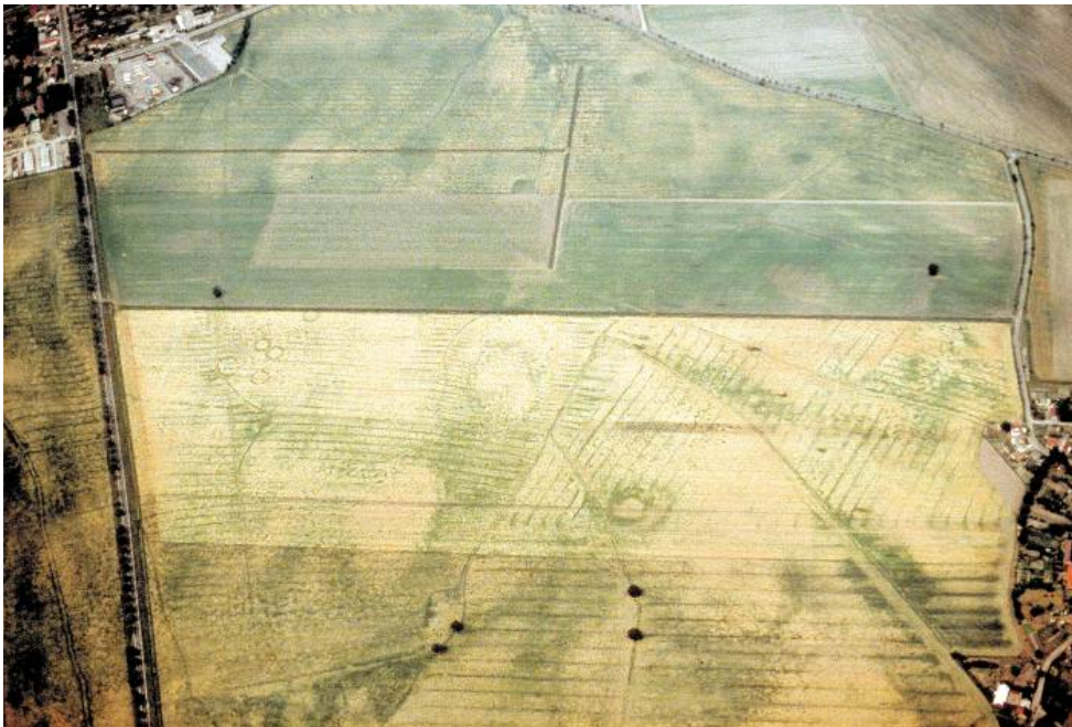
Foto: Grabhügel der Bronzezeit, mittelalterliche Wölbäcker, Gewinnflureinteilung und jüngere Meliorationsgräben, Friedersdorf, Elbe-Elster.

Von Seiten der Fachbehörden ist darauf hinzuwirken, dass Auswirkungen auf Archivböden in Umweltprüfungen, Strategischen Umweltprüfungen und Umweltverträglichkeitsprüfungen in allen Planungsebenen so früh wie möglich aufgezeigt werden und somit in das Verfahren einfließen.