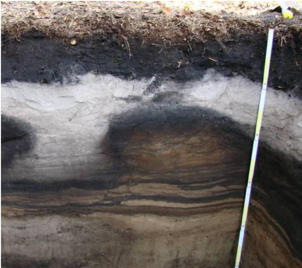
Foto: Eisenhumuspodsol mit Wurzeltopf.

Wegen der Überschneidungen der Definitionen und Zweckbestimmungen sowie wegen länderspezifischer Unterschiede ist keine generelle Abgrenzung der Rechtsbereiche Naturschutz, Bodenschutz und Denkmalschutz möglich, sondern im Einzelfall eine Zuordnung vorzunehmen. Auch eine parallele Schutzausweisung nach mehreren Gesetzen ist nicht ausgeschlossen (vgl. auch MUNLV 2004).