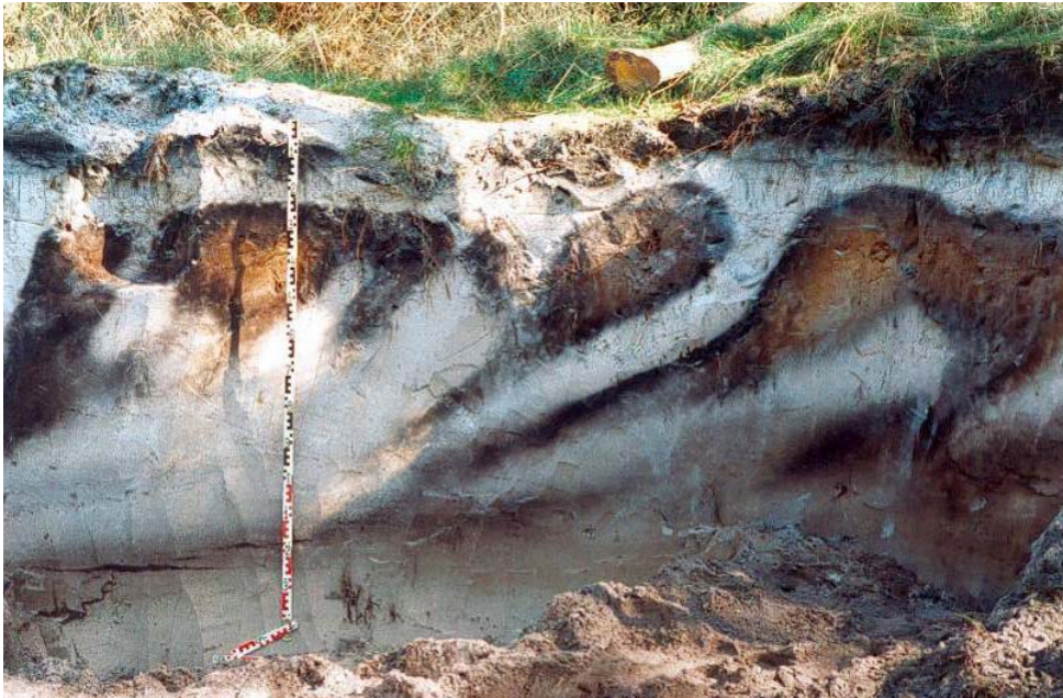
Foto: Podsol aus Geschiebedecksand über Sand der Haltern-Schichten. Quelle: Geologischer Dienst NRW