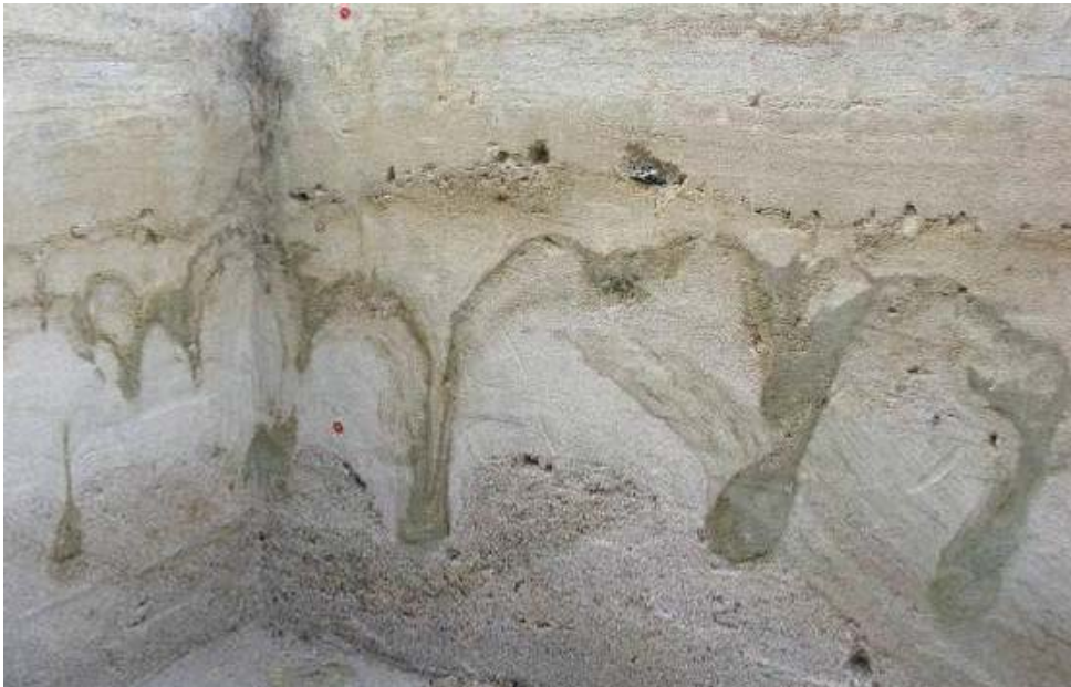
Foto: Tropfenbodenbildung durch Frostbodenklima.

Insgesamt sollte der Boden gleichberechtigt (z. B. gegenüber den Schutzgütern Pflanzen und Tiere) als Schutzgut und Bestandteil des Naturhaushaltes in der Umsetzung der Eingriffsregelung Berücksichtigung finden.